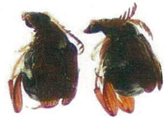
アズキゾウムシ 成虫