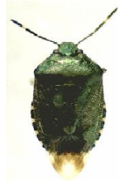
スコットカメムシ成虫