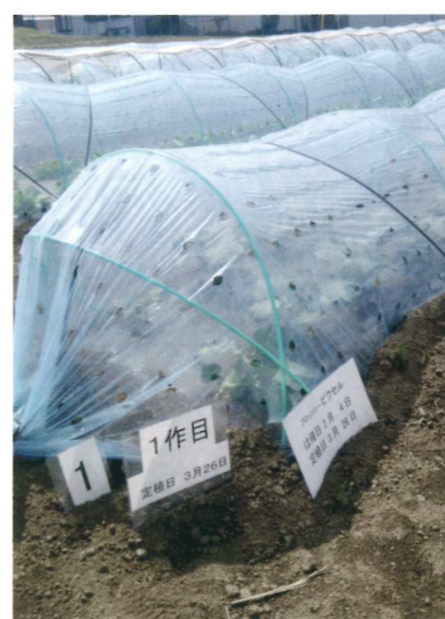
1作目のトンネル栽培(ブロッコリー)

年3作・1回施肥栽培は、施設を使わず土地利用効率を高めることができるため、今後、導入する会員が増えていくことが期待されます。