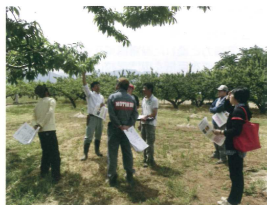
モモの摘果講習会