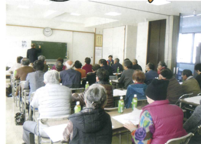
基礎的栽培講習会