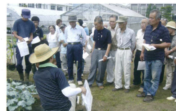
年3作栽培検討会の様子