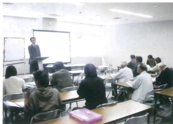
経営研修会(中北農務事務所)

近年、規模拡大や経営の効率化を目指す農家や、異業種から農業に参入した企業による、法人の設立が増えてきています。これらの農業法人は耕作放棄地解消や雇用の創出、若者の研修受け入れ先など地域農業を支える担い手にもなっています。普及センターでは、各農業法人がさらに経営安定し発展出来るように、支援を行っています。