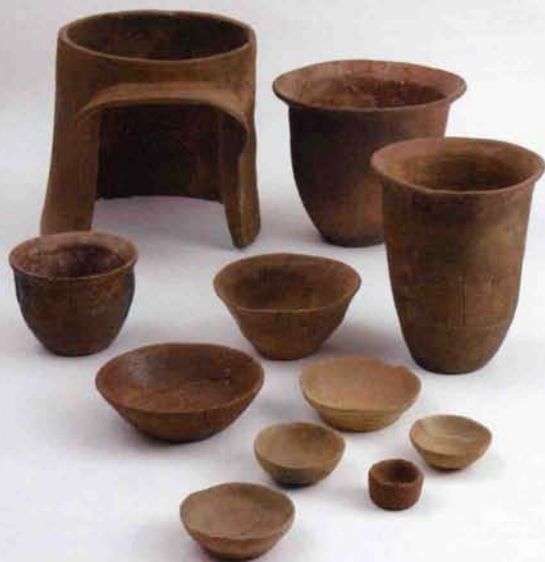
きたぼり 8世紀（北堀遺跡）