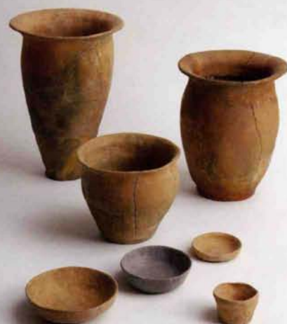
みなみほりのうち 8世紀（南堀之内遺跡）