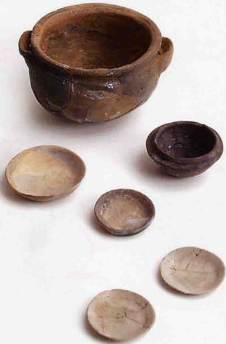
13世紀～14世紀 だいしひがしたんぼ (大師東丹保遺跡)