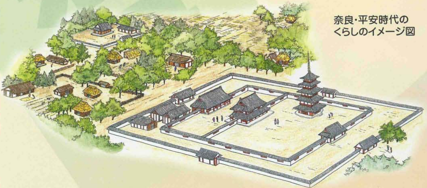
奈良・平安時代の くらしのイメージ図