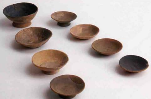
11世紀 (うぼづか) (姥塚遺跡)