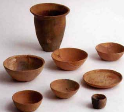
きくらいばた 9世紀（桜井畑遺跡）