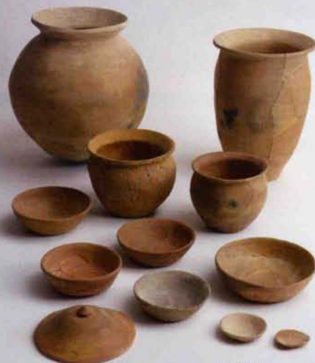
おおつか 8世紀（大塚遺跡）