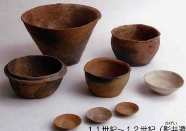
11世紀～12世紀 (かげい) (影井遺跡)