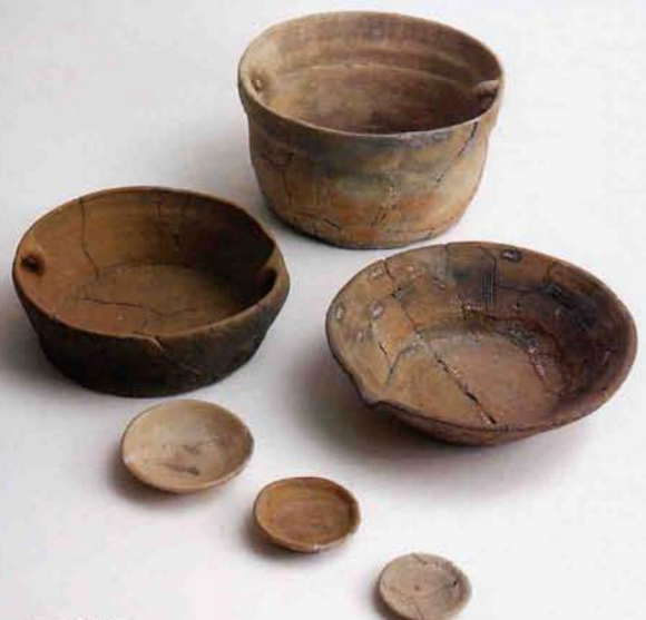
16世紀 だいりんじひがし さくらいばた にほんやなぎ (大輪寺東遺跡 / 桜井畑遺跡 / 二本柳遺跡)