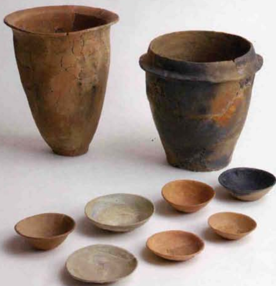
10世紀 (しおかわ てらどこ) (塩川遺跡 / 寺所遺跡)