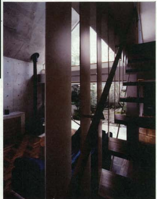
居間・階段から中庭を見る