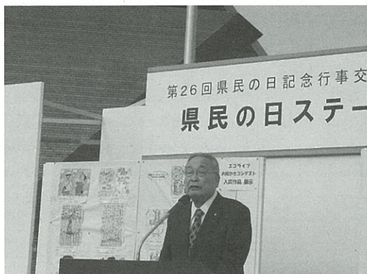
県民の日記念行事のステージで表彰式を行いました