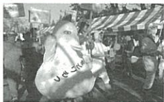
ゆるキャラにも協力していただきました

県民の日記念行事は、パンフレットにも「マイバッグの持参」や「ごみの持ち帰り」について掲載が行われ、来場者、出展団体の皆さんの協力により、「環境にやさしいイベント」