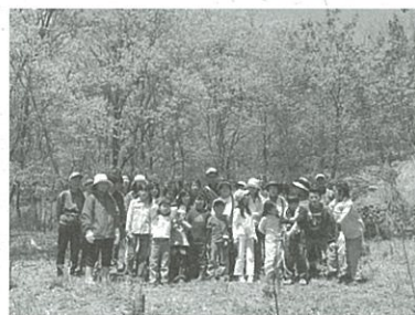
櫛形山の植林参加者