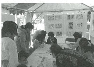
お絵かき大会の様子