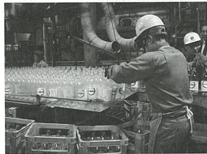
Rびんをキレイに洗浄している作業です。

現在、生活クラブでは、7種類のリユースびんを採用しています。調味料やジュースなど、中身の違うものでも、できるだけびん容器の大きさをそろえることによって、回収・洗浄・選別というリユースに不可欠な作業の効率アップにとりくんでいます。また、2000年には、さらに取り組みを広げ、牛乳も紙パックからリユースびんに切り替えました。そして、牛乳のプラスチックキャップのリサイクル回収や、配達用のピッキング袋もリサイクル回収を始め、地球にやさしい「ごみを出さない暮らし方」を進めています。