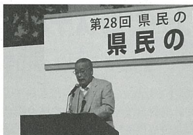
県民の日記念行事ステージで 表彰式を行いました

受賞者には小さなお子様も多く、我が子の勇姿を記録すべく、デジタルカメラやビデオカメラを持った保護者の方が多く見受けられました。