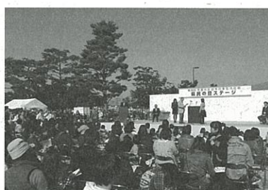
出席者150名以上の大規模な 表彰式となりました