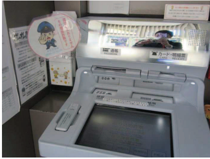
電話詐欺対策（ATM へのイラスト掲示）