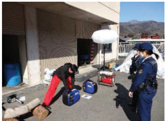
災害資機材の点検整備、操作要領の確認