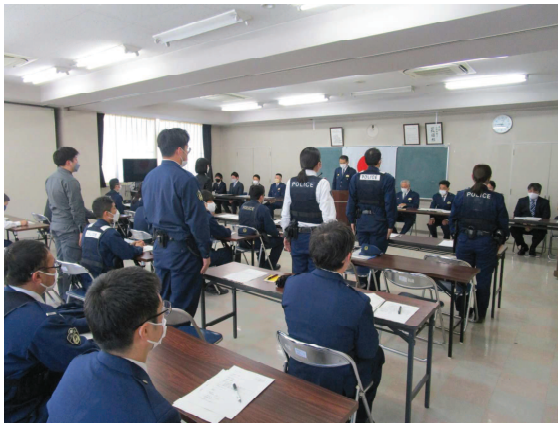
警察官採用リクルーター指定式