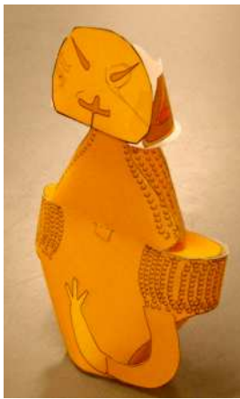
できあがりは こんな感じ