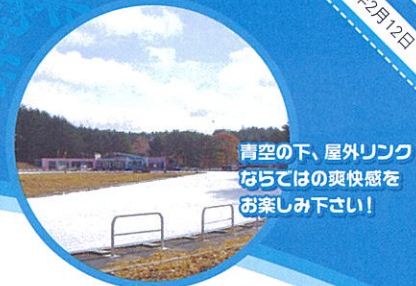
青空の下、屋外リンクならではの爽快感をお楽しみ下さい！

半額券 1枚 50円まで 有効期間 平成29年11月20日～平成30年2月12日 キリトリ線