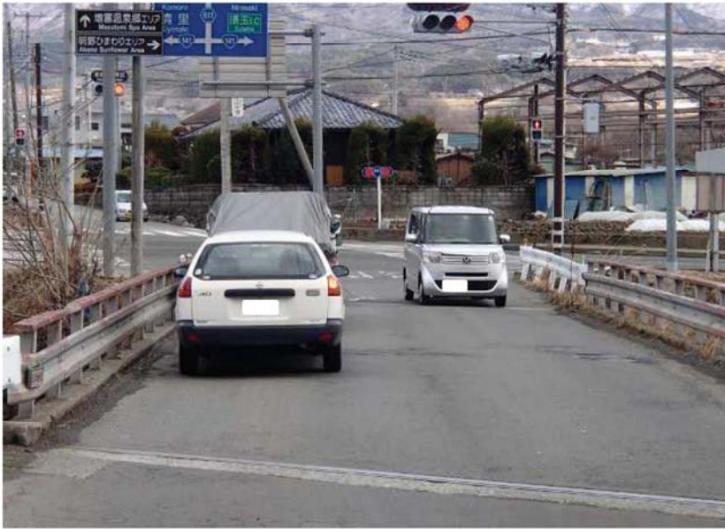
① 薬師堂橋から国道141号を望む