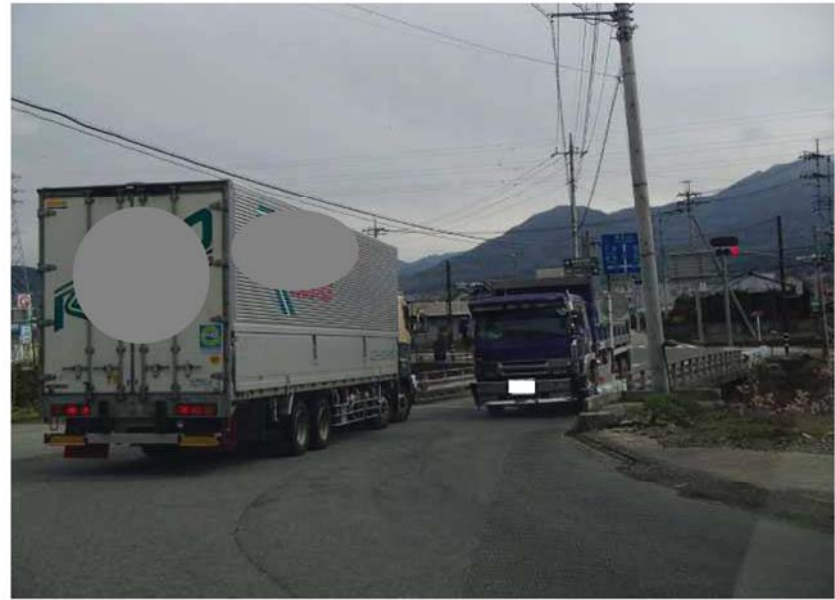
② 薬師堂橋側から国道141号を望む