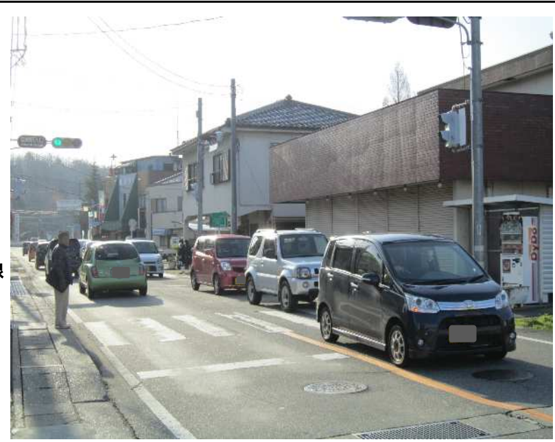
塩崎駅入口 交差点 (韮崎市→甲府市)