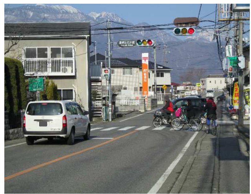
塩崎駅在所前 交差点 (甲府市→韮崎市)