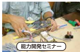
能力開発セミナー