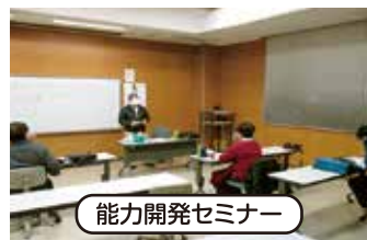
能力開発セミナー