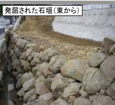
発掘された石垣(東から)

【名称】県庁構内石垣 【概要】県庁防災新館建設工事(H25年完成予定) 【調査】○平成22年から実施中 ○甲府城築城期の石垣が検出 ○将来的には一部を移設展示を計画中