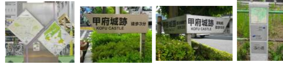
甲府城跡周辺案内板

【名称】県庁構内石垣 【概要】県庁防災新館建設工事(H25年完成予定) 【調査】○平成22年から実施中 ○甲府城築城期の石垣が検出 ○将来的には一部を移設展示を計画中