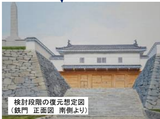
検討段階の復元想定図(鉄門 正面図 南側より)