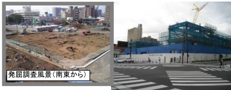
発掘調査風景(南東から)

【名称】NHK甲府放送局 【概要】H24完成予定 【調査】○H18までに発掘調査 ○武家屋敷や甲府駅の遺構が検出