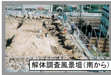
解体調査風景垣(南から)

【名称】県指定史跡稲荷櫓 【利用】稲荷曲輪：午前9時～午後5時(入場は4時30分まで・月曜休) 【概要】絵図、古文書、古写真による復元建物(在来工法) ○発掘調査出土品[鯺瓦、軒瓦、陶磁器等] ○城内外解説パネル ○稲荷櫓復元記録ビデオコーナー ○甲府城模型 ○稲荷櫓木組体験、石工道具