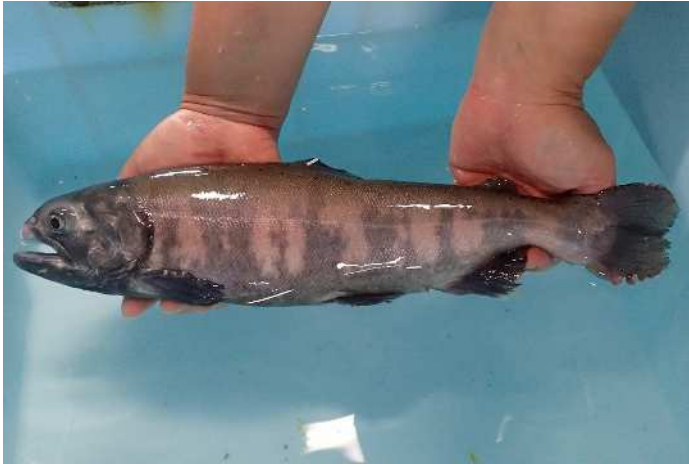
図1 クニマスの精子を排精した代理親魚 (サクラマス)