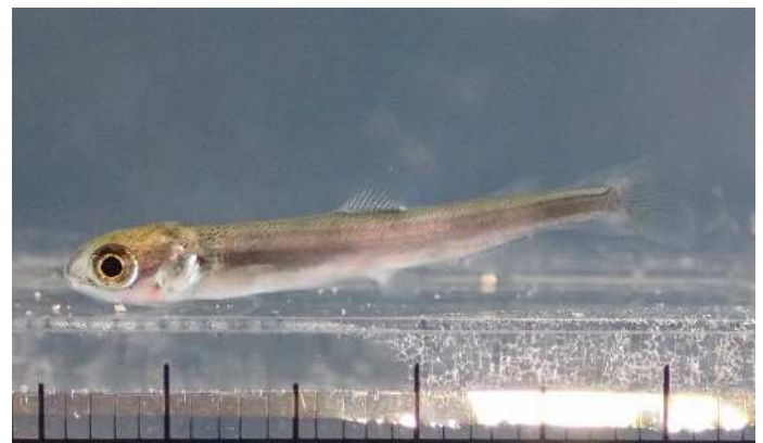
図4 養成親魚から得たクニマス稚魚 (撮影:平成28年2月26日)