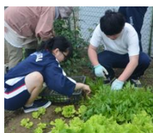
総合的な学習の時間