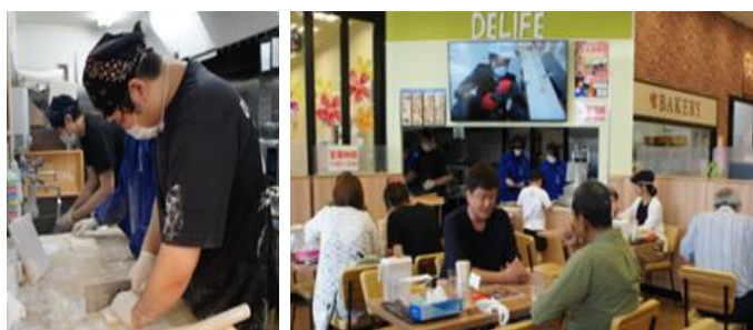
セルバ本店でのうどんの提供

新たに開発した「すりだね」で審査員特別賞を受賞した。さらに、現在、毎週日曜日、夏休みは土日に「セルバ本店」にてうどんを提供している。うどん部員が「セルバ本店」のアルバイトとして雇用される中で、うどんを作るだけでなく、