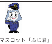
山梨県警マスコット「ふじ君」

東京2020オリンピック・パラリンピック自転車競技(ロード)開催! 【オリンピック】 2020年7月25日(土)~26日(日)・29日(水) 【パラリンピック】 2020年9月1日(火)~4日(金)