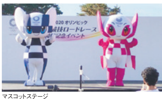
マスコットステージ