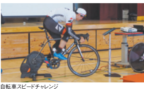
自転車スピードチャレンジ

●問い合わせ先/オリンピック・パラリンピック推進課 055-223-1519 055-223-1578 山梨 オリンピック