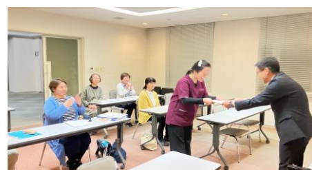
手話通訳入門（都留会場）

手話通訳養成講座Ⅲの修了生は、12月に手話通訳認定試験があります。これまで学習してきたことを試験当日、十分に発揮し、合格されますよう応援しています。聞こえない人と聞こえる人をつなぐ通訳者を目指して頑張ってください。