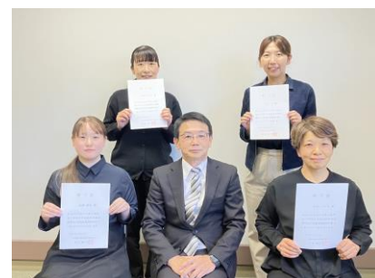
手話通訳養成講座Ⅲ

9月16日（土）に市川三郷町・富士川町、9月26日（火）に甲府市の手話奉仕員養成講座の受講生の皆さんが当センターを見学しました。聞こえない方の環境を知り今後の学習に結び付けてほしいと思います。