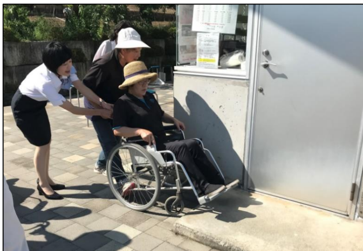
接遇マナー向上研修の様子

宿泊業や飲食業などの観光事業者や観光施設等の従業員等のマナー向上の機会を提供するほか、企業の生産性向上を図る経営者や高いサービススキルをもった従業員の取り組みを紹介することなどにより、サービスの高度化を推進します。