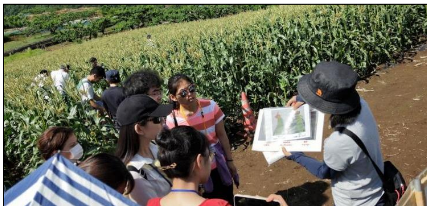
やまなし情報発信モニターツアーの様子

2020年東京オリンピック・パラリンピックなどの好機を捉えるとともに、そのクラウディングアウト現象 ※ に対応するため、富士の国やまなし観光ネット外国語ページや外国語でのSNS、外国語版パンフレットなど、様々なメディアを連携させ、本県の魅力的な地域資源を活用した、観光の付加価値を高める情報発信を行います。