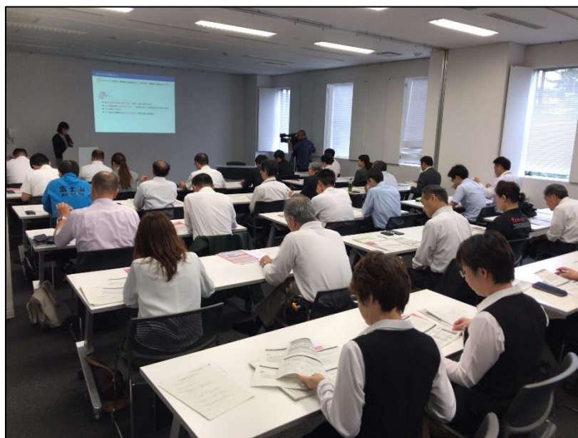
やまなし観光推進機構主催「観光産業の生産性向上講座」

観光産業の「稼ぐ力」と「働く魅力」を高めるため、日本版DMOとして登録された（公社）やまなし観光推進機構により、ホテルや旅館など観光事業者の生産性向上や外国人旅行者の受入対応に関する情報提供などを推進し、より収益力の高い観光産業を育成します。