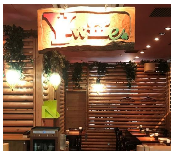
山梨県アンテナショップ