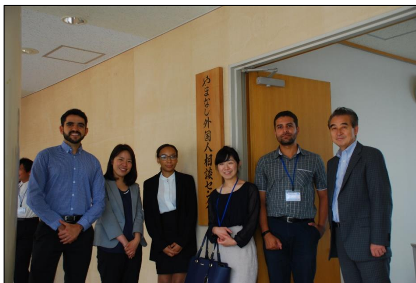
やまなし外国人相談センターの開設（令和元年（2019年）8月）

また、出入国管理及び難民認定法の改正により、今後、様々な業種に従事する外国人材の増加が見込まれることから、彼らが生活・就労等に関する適切な情報を速やかに取得できるような環境整備を推進します。