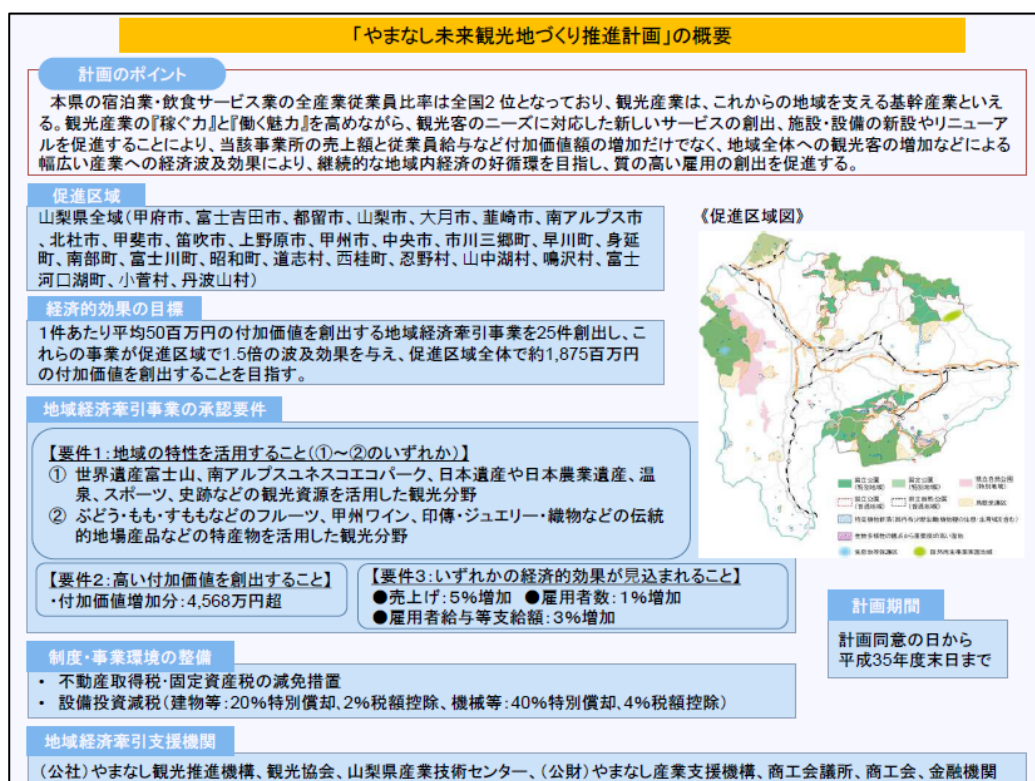
やまなし未来観光地づくり推進計画 (概要)

地域未来投資促進法に基づき策定した「やまなし未来観光地づくり推進計画」による、宿泊施設等の新設やリニューアル、ユニバーサルツーリズムなどを促進する新たなサービスの創出に係る観光事業者の取り組みに対して、税の減免等により支援していくことにより、地域経済の好循環と質の高い雇用の創出を目指します。