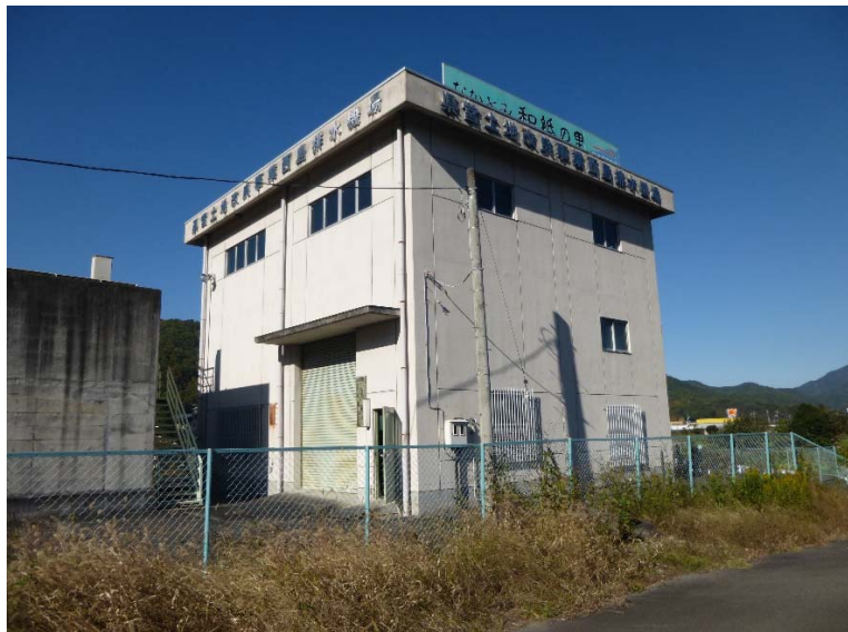
①西嶋排水機場の全景