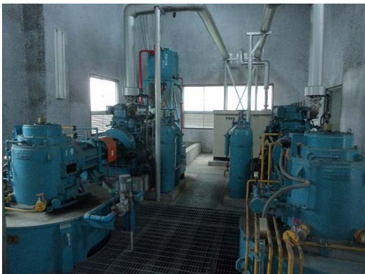
③現況のポンプ状況