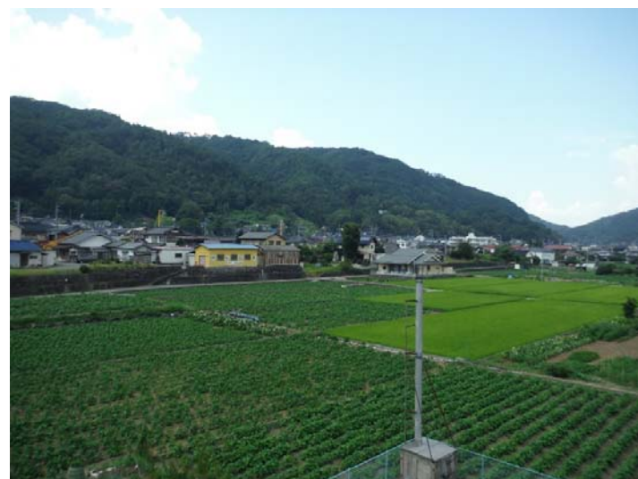
④湛水により被害が生じる恐れのある農地(受益地)