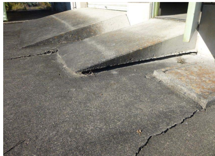
②排水機場基礎部に発生しているひび割れの状況