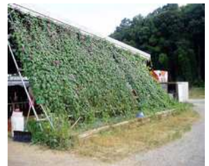
ネットに植物を這わせる