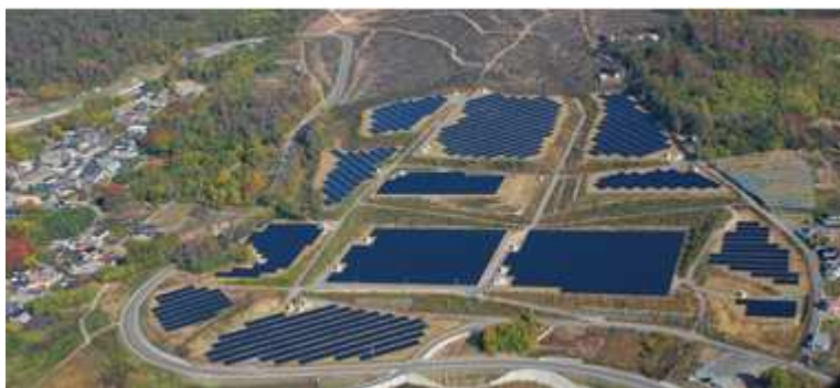
「やまなしメガソーラー(韮崎)」 出力5,266kW(認定出力3,750kW) 平成26年1月運転開始