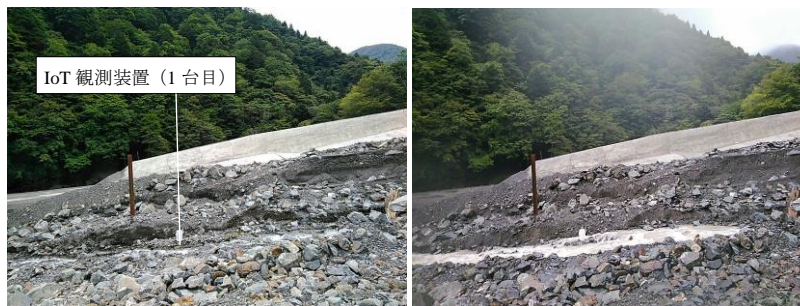
図3 IoT観測装置(2台目)から自動送信された春木川の画像(左:台風通過前,右:台風通過後の増水時)

実証試験エリアのように災害発生の危険度が特に高い場所において、遠隔地からの画像等のリアルタイム観測が実際の災害観測に有用であること、また、開発したIoT観測装置の災害観測への適用が比較的容易に行えることがわかった。