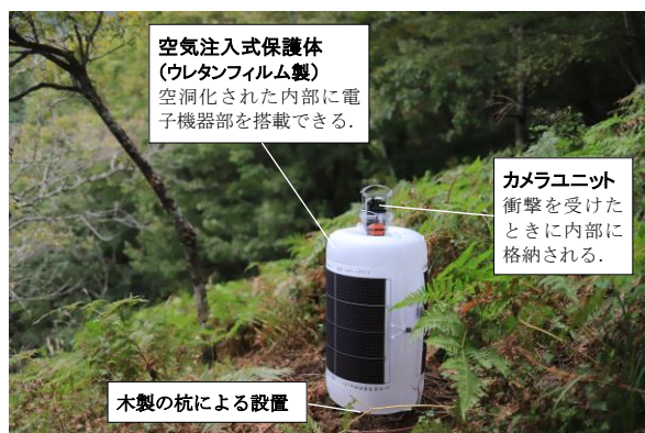
図1 IoT観測装置の外観(斜面崩落の観測時)

豊富な森林環境と密接に関わりを持つ本県においては、雪崩や土砂災害等の斜面崩壊による災害に備えることが重要な課題となっている。しかし、危険を伴うこのような観測分野においては、周囲情報を効果的・効率的に収集できる観測装置はまだ開発されていない。本研究では、被災後も損壊せず回収が可能で、遠隔地から映像等様々なデータの取得が期待できるIoT観測装置の開発に取り組む。