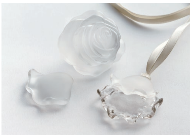
甲州水晶貴石細工

山梨県の風土と悠久の歴史のなかで生まれた国指定伝統的工芸品。匠の技と伝統に育まれた優れたものづくりを、脈々と受け継いでいます。