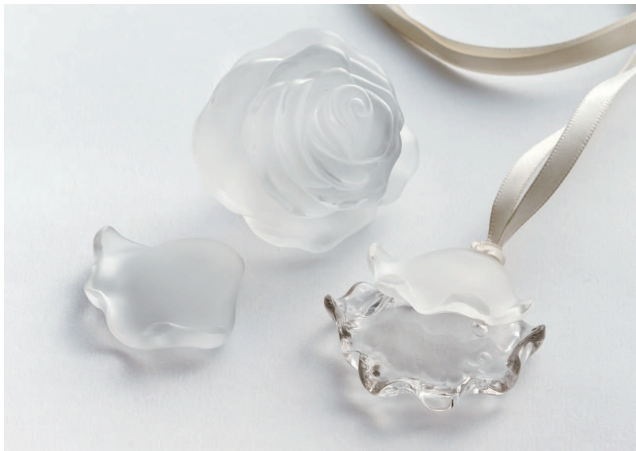
甲州水晶贵石工艺

山梨县特有风土与悠久历史孕育出的国家指定传统工艺品。匠人的技艺与传统滋养而成的卓越品质，仍在不断代代传承。