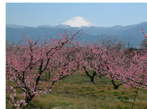
富士山とモモの花