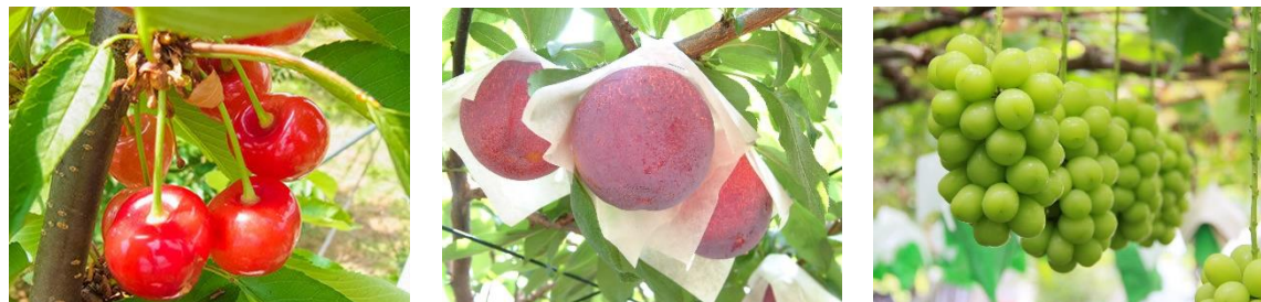
南アルプス市が誇るフルーツ（サクランボ・スモモ・シャインマスカット）