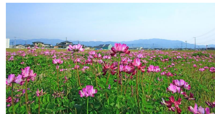
田園に広がるれんげ

全国住みよさランキング（東洋経済「都市データパック」編集部発行）では、毎年山梨県内の市で上位を獲得しています。