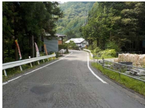
② 県道(一般県道 戸沢谷村線)