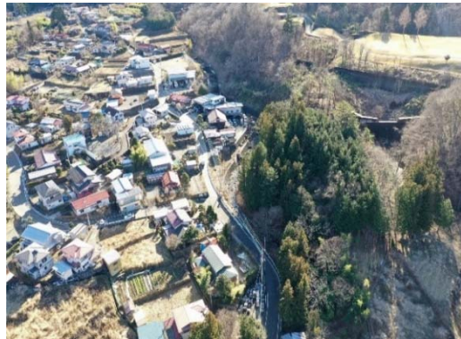
① 保全対象(人家・県道・市道)