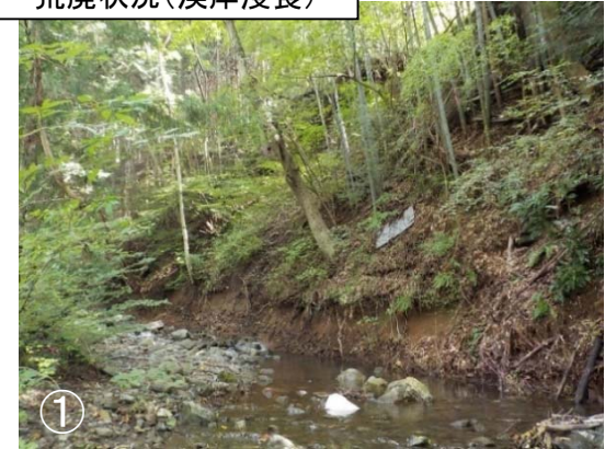
荒廃状況(溪岸浸食)